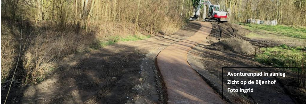
Avonturenpad in aanleg Zicht op de Bijenhof

Een nieuwe titel voor de Voedselbos Nieuwsbrief omdat de groep Voedselbos met ingang van dit jaar nauw samenwerkt met de groep Kleinschalig Beheer Park Uithof, onder de mantel van de Stichting Belangen Park Uithof.